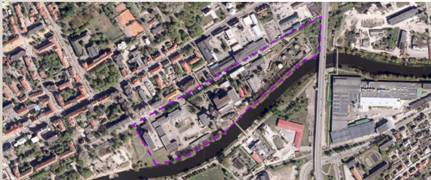
Klaipėdos miesto Bendrasis planas (2021 m.)

Teritorijoje planuojamas mišrios centro bei mišrios gyvenamosios teritorijos. Siūloma vystyti gyvenamosios paskirties statinius (57.3%), komercinius objektus (20%) ir viešąsias erdves kartu su želdiniais (22.7%);