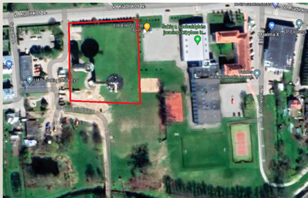
Žemės sklypo plotas 0,3882 ha.

Žemės sklypas priklauso UAB Šakių vandenys, sklypo plotas 2,01 ha, kurio dalyje (apie 40 a.) yra minimas vandens bokštas. Senasis bokštas yra apie 35 m. aukščio, bokšto liemuo sudaro 27,70 m. išorinis skersmuo 7,73 m. Bokšto kepurės aukštis 4,70 m. skersmuo 10,25 m. Stogas medinė konstrukcija. Senasis bokštas yra 6 aukštų, kurie buvo atskirti medinėmis perdangomis (perdangos supuvusios). Bokšto liemuo ir kepurė sumūryta iš plytų. Šalia jo yra senasis vandens bokštas, kuris taip pat nenaudojamas. Liemens aukštis 42 m. bendras apie 54 m. Netoli minimo sklypo teka Siesarties upelis.